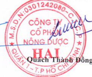
Quách Thành Đồng